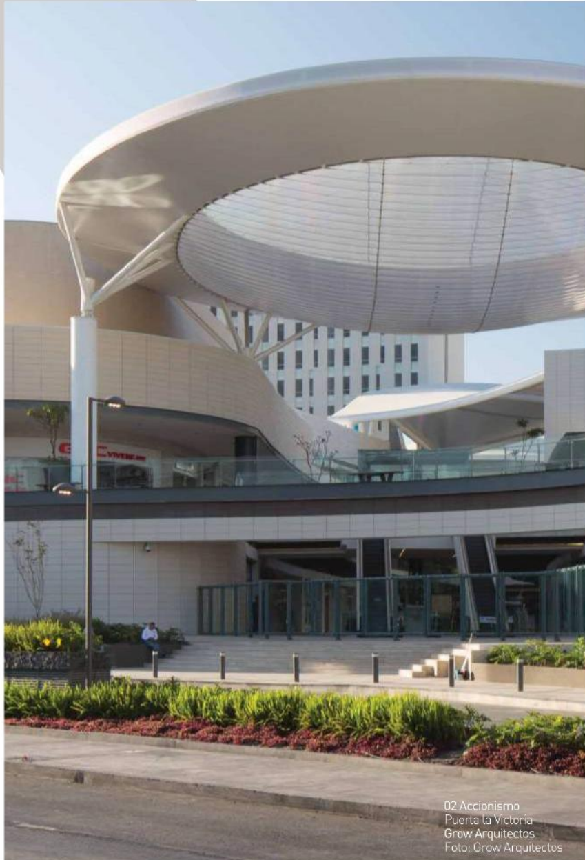
02 Accionismo Puerta la Victoria Grow Arquitectos