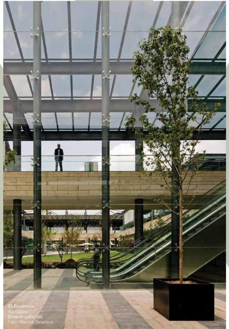
03 Endémico Via Vallejo Grow Arquitectos