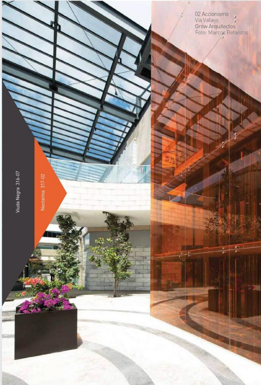
02 Accionismo Via Vallejo Grow Arquitectos